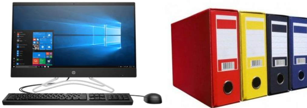
Илустрација број 4: Евидентирање и документовање радњи током планирања јавних набавки

Према члану 41 став 1 Закона о јавним набавкама наручилац је био дужан да у писаној форми евидентира и документује све радње током планирања јавних набавки. Иста одредба била је предвиђена чланом 16 претходно важећег Закона.