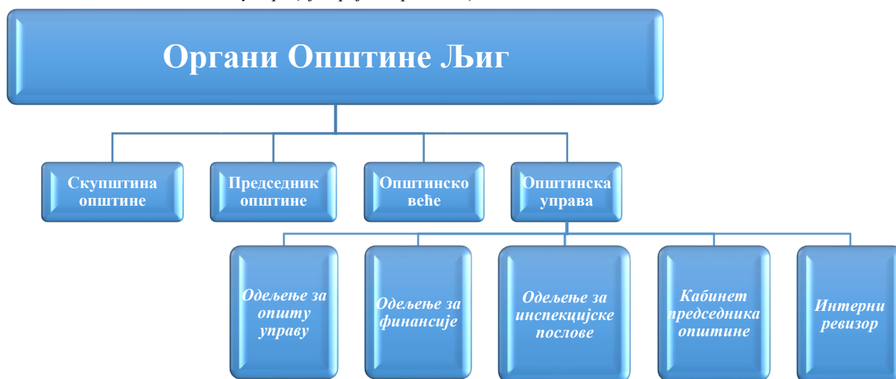
Илустрација број 1: Организациона шема Општине Љиг

Послови јавних набавки се обављају у оквиру Одељења за општу управу.