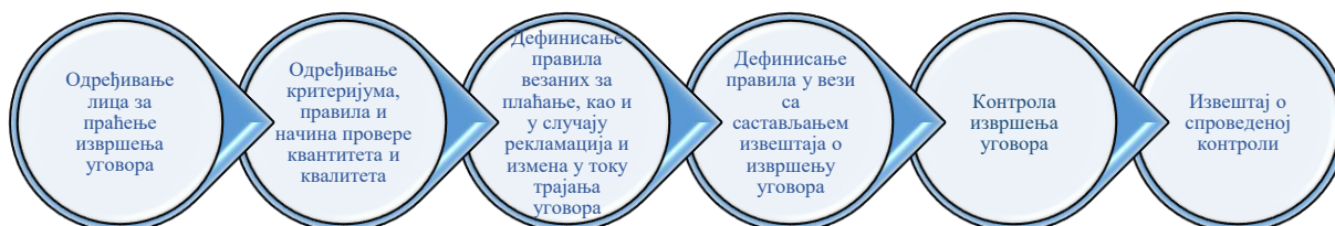
Илустрација број 7: Праћење извршења уговора

Након извршене контроле, лице за контролу сачињава нацрт извештаја о спроведеној контроли и исти доставља субјекту контроле. По изјашњењу субјекта контроле и неопходних усаглашавања, лице за контролу сачињава извештај о спроведеној контроли 104 .