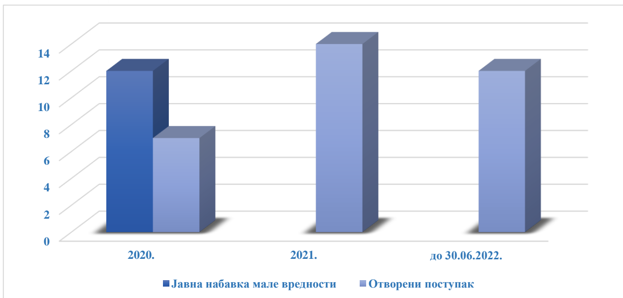
Табела број 4: Укупан број планираних врста поступака јавних набавки по ДКБС у ревидираном периоду