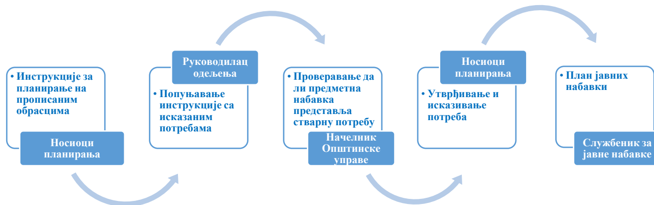
Илустрација број 2: Поступак планирања набавки

Доношењем новог Закона о јавним набавкама 71 , наручилац је био дужан да посебним актом ближе уреди начин планирања, спровођења поступка јавне набавке и праћења извршења уговора о јавној набавци (начин комуникације, правила, обавезе и одговорности лица и организационих јединица), начин планирања и спровођења набавки на које се закон не примењује, као и набавки друштвених и других посебних услуга. Законом није прописана обавеза Канцеларије за јавне набавке да ближе уреди садржину овог акта, тако да су наручиоци дужни да самостално уреде садржину предметног акта.